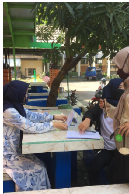
Simbolis penyerahan Dana