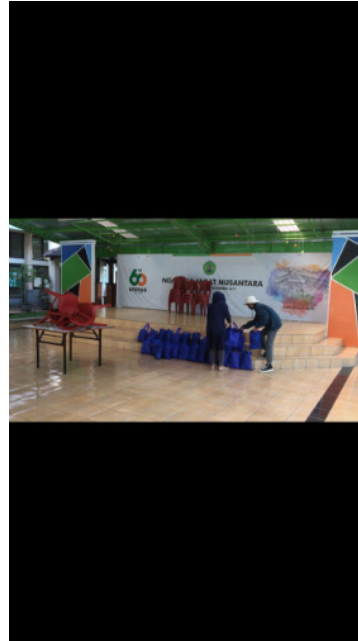
Inventarisasi Penerima layak donasi