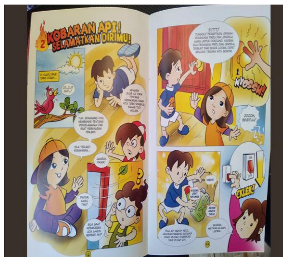
Gambar 1 : Buku Cerita untuk Materi Pelaksanaan

Dongeng menyebabkan mereka dapat memetakan secara mental pengalaman dan melihat gambaran di dalam kepala mereka, mendongengkan dongeng tradisional menyediakan anak-anak suatu model bahasa dan pikiran bahwa mereka dapat meniru. Sementara Sanchez dkk. (2009) mengungkapkan kekuatan utama strategi dongeng adalah menghubungkan rangsangan melalui penggambaran karakter. Dongeng memiliki potensi untuk memperkuat imajinasi, memanusiasikan individu, meningkatkan empati dan pemahaman, memperkuat nilai dan etika, dan merangsang proses pemi k iran kritis/kreatif (Ahyani, 2010).