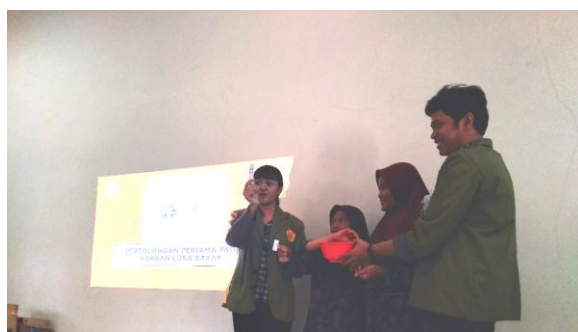
Gambar 2: Foto Mahasiswa UPN memberikan sosialisasi kepada anak panti asuhan (25/8/2019) cara membersihkan luka bakar sebelum mendapatkan pengobatan luka bakar

Selain pembacaan dongeng Tim Abdimas yang juga melibatkan beberapa mahasiswa Fakultas Kesehatan UPN Jakarta untuk melakukan sosialisasi pertolongan pertama pada korban luka bakar. Meski umur mereka belum usia dewasa, anak-anak yatim piatu di Panti Asuhan Nurul Hasanah juga diberikan pembekalan dan simulasi memberikan pertolongan korban luka bakar. Dari materi ini anak-anak yatim piatu mengenal jenis luka bakar dan bagaimana mengatasi luka bakar dari membersihkan luka sebelum akhirnya mendapatkan pengobatan pertama luka bakar yang jika dibiarkan dapat berakibat luka serius dan infeksi. Seperti dalam foto di bawah ini.