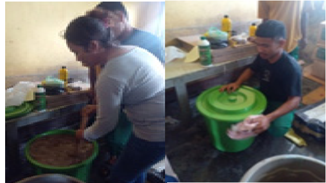
Gambar 4. Proses Fermentasi POC

Aduk hingga homogen dan tutup rapat ember tersebut sampai 14 hari. Pada tahap fermentasi ini ember harus ditutup rapat karena fermentasi dilakukan secara anaerob. Setiap 3 hari ember dibuka tutupannya untuk mengeluarkan gas.