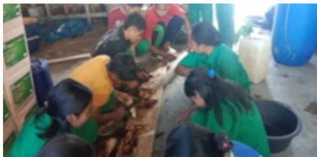
Gambar 3. Proses Tahap Menghaluskan Bonggol Pisang

Bonggol pisang sebanyak 5 kg dipotong-potong lalu ditumbuk sampai halus menggunakan lumpang. Untuk limbah air cucian beras sudah ditampung selama 1 minggu sebanyak 15 liter.