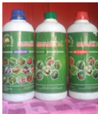
Gambar 1. Decomposer, Nutrisi dan ZPT & Hormon Bowuli Subur Makmur

Nutrisi mengandung mikroba tanah yang berfungsi sebagai unsur hara makro maupun mikro untuk meningkatkan pertumbuhan dan perkembangan suatu tanaman hal ini sejalan dengan penelitian yang dilakukan oleh Bay, J.R.dkk (2024) menunjukkan bahwa pemberian pupuk organik cair jenis Nutrisi BSM mempengaruhi pertumbuhan tanaman padi varietas Inpari 30 dan Kusuma 06 terutama pada tinggi tanaman, jumlah anakan dan jumlah daun.