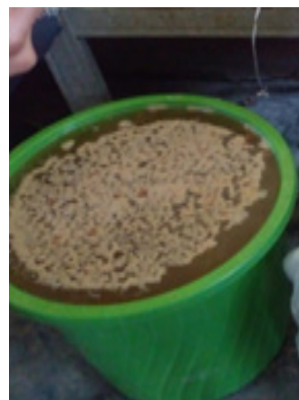
Gambar 5. Warna POC Hasil Fermentasi

Setelah 14 hari, jika pupuk ini sudah berbau tape maka pupuk organik cair ini sudah bisa digunakan. POC bonggol pisang dipanen dengan cara disaring agar terpisah dari ampasnya. Ampasnya ini bisa kita jadikan sebagai pupuk padat untuk tanaman. Pupuk organik cair larutannya kuning kecoklatan.