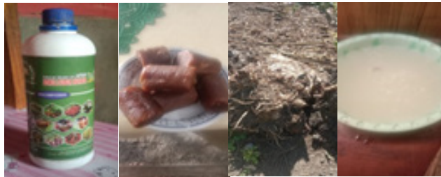
Gambar 2. Bahan Pembuatan Pupuk Organik Cair (POC)

lumpang. Dalam pembuatan POC dibutuhkan pula bahan-bahan seperti bioaktivator decomposer Bowuli Subur Makmur, gula aren, limbah bonggol pisang, limbah air cucian beras serta air sumur.