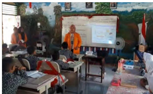
Gambar 2. Perkenalan Diri dari Pemateri Demi Kelancaran Proses Pembelajaran

Koordinasi ini bertujuan untuk menjelaskan mengenai waktu pelaksanaan, karakteristik siswa-siswi kelas 2, dan beberapa hal-hal lainnya sebagai penunjang proses pembelajaran berlangsung.