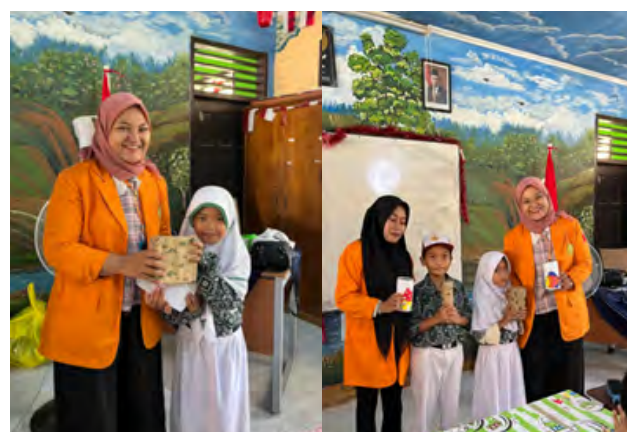
Gambar 8. Pemberian apresiasi

Proses akhir dari kuis ialah pengumpulan, dan penjelasan terakhir untuk tahap terakhir kuis yang telah diberikan kemudian disambung dengan mengulas materi dan kuis yang telah diberikan.