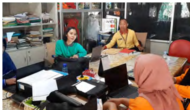
Gambar1. Koordinasi Bersama Dewan Guru Sebelum Proses Belajar

Proses pembelajaran berlangsung selama kurang lebih 40 menit ini berjalan dengan lancar. Semangat belajar dari siswa-siswi SD Negeri 015 sangatlah tinggi, dengan keterbatasan waktu yang ada mereka mampu untuk memahami materi yang diberikan oleh pemateri. Hal ini bisa dilihat dari hasil kerja mereka yang nyaris mendapatkan nilai yang sempurna. Proses pembelajaran di akhiri dengan pemberian hadiah kepada 3 siswa dengan nilai terbaik.