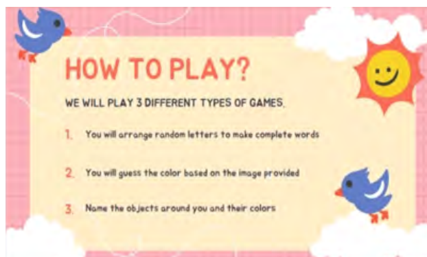
Gambar 3. Pemaparan Slide ke 1

Perkenalan diri dilakukan di awal kegiatan sebagai pembuka untuk mengenal lebih dekat siswa-siswi yang hadir, selain itu perkenalan juga dimaksudkan untuk membangun suasana kelas yang aktif .