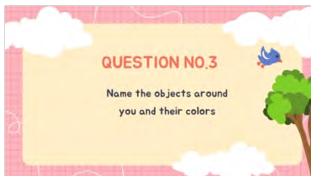
Gambar 7. Kuis Ketiga

Pada gambar 8 ini siswa diharapkan mampu melengkapi huruf yang hilang serta menjadi satu kesatuan kata yang memiliki arti warna dalam bahasa Inggris.