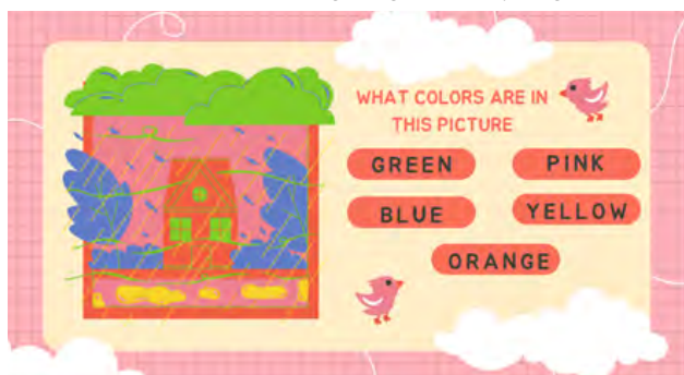
Gambar 4. Pemaparan Slide ke 2

Materi yang disampaikan meliputi cara belajar dan bermain serta penampilan gambar dan warna, kemudian dsambung dengan penyampaian mengena warna-warna dalam bahasa Inggris. Meliputi penyampaian gambar dan beberapa bahasa Inggris warna-warna yang ditampilkan sesuai dengan gambar yang ada.