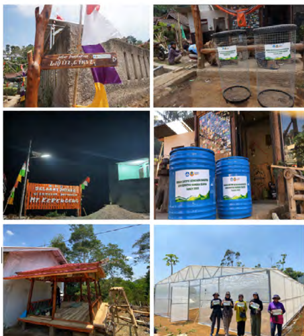
Gambar 4 Infrastruktur Baru

Tahap selanjutnya yaitu pemasangan infrastruktur yang sudah dibuat sesuai dengan teori ergonomi dengan tujuan untuk memaksimalkan informasi yang disampaikan. Gambar 4 menunjukkan infrastruktur yang telah diperbaharui.