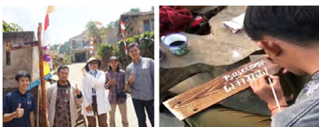
Gambar 6 Kontribusi Mitra

Realisasi kerjasama dan kontribusi mitra dilakukan secara in-kind dengan menyiapkan lahan dan pembuatan untuk display, pembelian bahan baku pembuatan alat dan teknologi serta pemasangan display yang ditunjukkan pada Gambar 6.