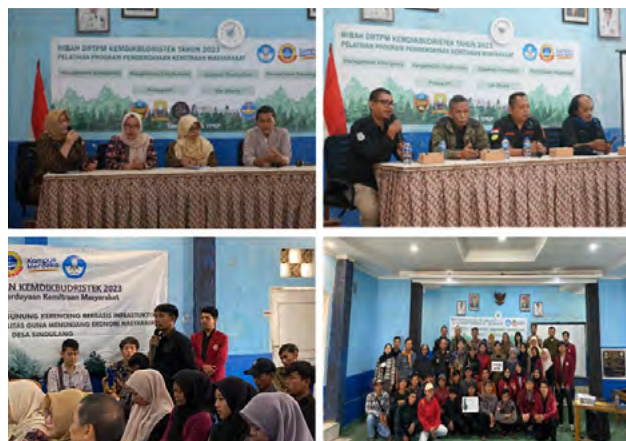
Gambar 5 Pelaksanaan Pelatihan

Pelatihan dilaksanakan di aula kantor Desa Sindulang dihadiri 21 peserta anggota Volunteer Gunung Kerenceng dan dibuka oleh Kepala Desa Sindulang. Gambar 5 menunjukkan berlangsungnya kegiatan pelatihan.