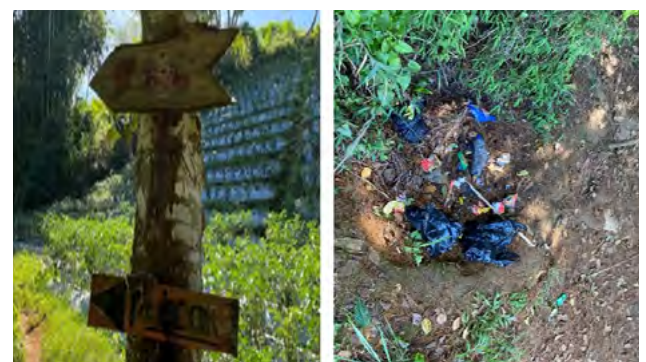
Gambar 3 Infrasadatur Lama

Setelah melakukan survei ke kaki Gunung Kerenceng, kemudian dilakukan perancangan konsep infrastruktur. Adapun konsep dibuat sebagai pembaharuan, rambu yang rapuh dan sudah termakan rayap sehingga kurang proporsionalnya rambu sebagai sarana informasi, sampah yang berserakan, kurangnya lampu penerangan di jalur pendakian yang mendekati pemukiman warga dan tempat singgah yang diperuntukkan masyarakat atau pengunjung kaki Gunung Kerenceng. Gambar 3 menunjukkan kebutuhan pembaharuan Infrastruktur.