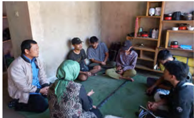
Gambar 1. Survei Awal Kegiatan

Survei awal melalui wawancara Karang Taruna dan warga setempat lainnya, mereka mengatakan bahwa memang Gunung Kerenceng khususnya di daerah kaki gunung terdapat lahan pertanian yang dikelola oleh para pemuda Karang Taruna yang terbentuk dalam kelompok tani milenials, dari beberapa anggotanya adalah Volunteer Kerenceng, perlu adanya infrastruktur yang memadai. Dengan adanya wawancara tersebut diketahui bahwa infrastruktur yang dibutuhkan dalam bentuk papan-papan ucapan selamat datang, rambu-rambu keterangan untuk jalur sekitar kaki Gunung Kerenceng dan lainnya. Survei awal dengan Volunteer Gunung Kerenceng, ditunjukkan pada Gambar 1.