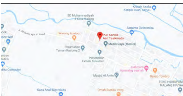
Gambar 1. Lokasi Makam Perumahan Puri Kartika Asri, Puskopad Kelurahan Tasikmadu

Elevasi makam berupa lereng yang sudah beberapa kali terjadi longsor pada pondasi pasangan batu kali yang pernah dibuat, kemungkinan besar pondasi dari plengsengan batu kali kurang dalam penggaliannya, jadi masih merupakan tanah urug yang labil terhadap longSORan saat hujan lebat kekuatan pondasi plengsengan menjadi tidak kuat dan ambrol. Pada elevasi terendah adalah tepi makam yang terhubung dengan sempadan atau pinggirian Sungai Mewek yang secara evolusi bisa semakin tergerus dan lebar sungainya bisa semakin lebar dan batas tepi makam menjadi tergerus berkurang. Lokasi Makan perumahan Puri Kartika Asri, Puskopad Kelurahan Tasikmadu sebagaimana pada Gambar 1.