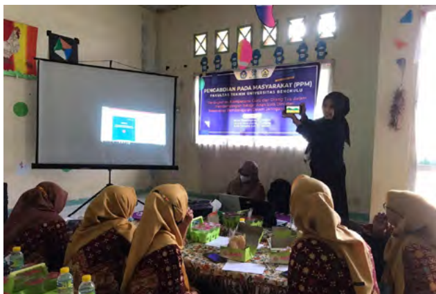
Gambar 2. Proses pemaparan materi

Langkah selanjutnya adalah dilakukannya pemaparan materi sebagai dasar pelatihan yang dilakukan pada tahap berikutnya. Pada tahap ini, mitra dilengkapi dengan booklet yang berisi panduan dalam membuat video menggunakan aplikasi Kinemaster, kegiatan ini ditunjukkan pada Gambar 2.