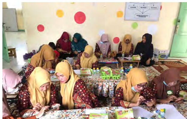
Gambar 3. Pelatihan membuat video pembelajaran

dalam aplikasi, perekaman video pembelajaran menggunakan kamera smartphpne, melakukan editing video hingga mengunduh hasil video pembelajaran yang telah dibuat oleh guru-guru TK menggunakan aplikasi kinemaster. Aktifitas ini ditunjukkan pada Gambar 3.