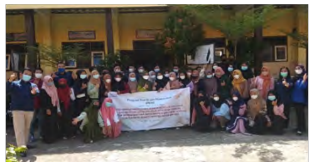
Gambar 5. Foto Bersama Peserta kegiatan PKM

Jenis rosella yang digunakan menggunakan merah dan jahe emprit. Produk minuman yang dihasilkan dominan menghasilkan warna coklat, hal ini dikarenakan rosella dan jahe mengandung antioksidan yang menghasilkan reaksi Mailard dengan ditandai intensitas warna coklat(Karseno et al., 2018). Kegiatan pengabdian ini juga diselingi dengan pembagian door prize bagi siswa yang dapat menjawab pertanyaan yang disampaikan oleh tim materi. Acara diakhiri dengan pemberian kenang-kenangan dan sesi foto bersama dengan seluruh anggota yang terlibat dalam acara pengabdian masyarakat ini.