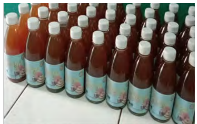
Gambar 4. Produk Minuman Roseja.

Jenis rosella yang digunakan menggunakan merah dan jahe emprit. Produk minuman yang dihasilkan dominan menghasilkan warna coklat, hal ini dikarenakan rosella dan jahe mengandung antioksidan yang menghasilkan reaksi Mailard dengan ditandai intensitas warna coklat(Karseno et al., 2018). Kegiatan pengabdian ini juga diselingi dengan pembagian door prize bagi siswa yang dapat menjawab pertanyaan yang disampaikan oleh tim materi. Acara diakhiri dengan pemberian kenang-kenangan dan sesi foto bersama dengan seluruh anggota yang terlibat dalam acara pengabdian masyarakat ini.