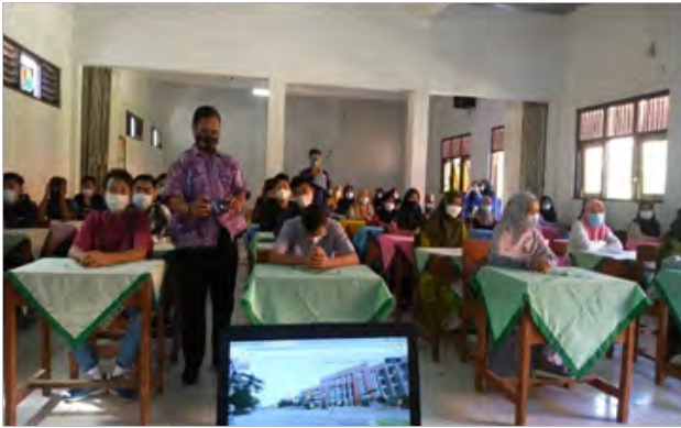
Gambar 3. Penyampaian materi Pembuatan Minuman Roseja.

Materi yang disampaikan adalah pemanfaatan tanaman rosella dan jahe untuk pembuatan minuman herbal berbahan rosella dan jahe (Roseja). Materi meliputi penyuluhan tentang manfaat rosella dan jahe untuk bahan dasar minuman herbal berbahan rosella dan jahe (Roseja) bagi siswa SMKKarya Bhakti Kab. Brebes. Kegiatan ini melibatkan empat mahasiswa untuk membantu pemateri dalam persiapan tempat, registrasi peserta, pembagian materi kepada peserta, serta membantu memperagakan pembuatan minuman herbal berbahan rosella dan jahe (Roseja). Demonstrasi pembuatan minuman herbal berbahan rosella dan jahe (Roseja).