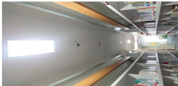
Gambar 2. CCTV diruang Baca Dewasa

Upaya menjaga keaman fisik buku yang ketiga adalah dengan membuat personil keamanan. Tugas personil keamanan yaitu berpatroli di dalam perpustakaan maupun di luar perpustakaan serta memanfaatkan CCTV guna melihat situasi ruang perpustakaan. Petugas keamanan atau satpam sangat diperlukan untuk menjaga perpustakaan dari hal yang tidak diinginkan. Kelima, menggunakan teknologi keamanan seperti CCTV. CCTV atau kamera pengintai adalah teknologi yang bisa mengamati segala aktivitas pemustaka di Perpustakaan Umum Daerah Provinsi Jawa Barat, serta hasil rekamannya bisa dijadikan sebagai barang bukti jika ada pelanggaran. namun untuk saat ini CCTV sedang tidak berfungsi, dan untuk pemustaka saat ini aman-aman saja tidak terjadi tindakan Bibliocrime . Tetapi sebagai pustakawan sudah berupaya untuk pencegahan Bibliocrime , begitupun alat-alat elektronik keamanan sudah ada.