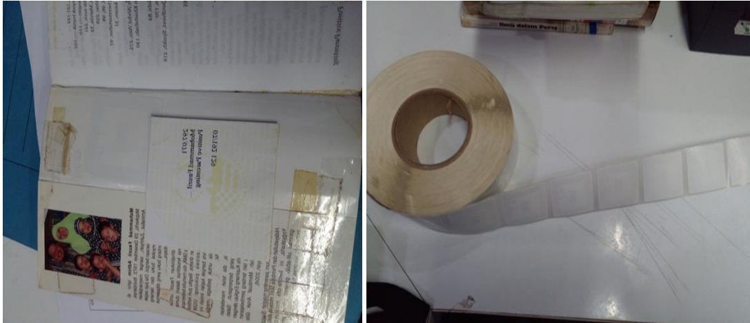
Gambar 1. Buku ditempelkan 3M

Upaya menjaga keaman fisik buku yang ketiga adalah dengan membuat personil keamanan. Tugas personil keamanan yaitu berpatroli di dalam perpustakaan maupun di luar perpustakaan serta memanfaatkan CCTV guna melihat situasi ruang perpustakaan. Petugas keamanan atau satpam sangat diperlukan untuk menjaga perpustakaan dari hal yang tidak diinginkan. Kelima, menggunakan teknologi keamanan seperti CCTV. CCTV atau kamera pengintai adalah teknologi yang bisa mengamati segala aktivitas pemustaka di Perpustakaan Umum Daerah Provinsi Jawa Barat, serta hasil rekamannya bisa dijadikan sebagai barang bukti jika ada pelanggaran. namun untuk saat ini CCTV sedang tidak berfungsi, dan untuk pemustaka saat ini aman-aman saja tidak terjadi tindakan Bibliocrime . Tetapi sebagai pustakawan sudah berupaya untuk pencegahan Bibliocrime , begitupun alat-alat elektronik keamanan sudah ada.