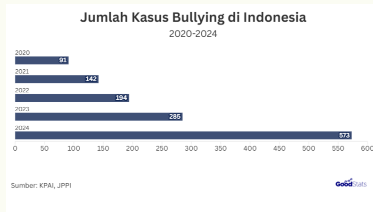
Gambar 1. Jumlah kasus perundungan

36,31 % peserta didik di Indonesia berpotensi menjadi korban perundungan, yang mencerminkan bahwa lebih dari sepertiga siswa berada dalam risiko mengalami bullying setidaknya sekali selama masa sekolah mereka. Tingginya angka ini menegaskan bahwa bullying bukanlah fenomena kasus tunggal tetapi merupakan tantangan struktural yang mempengaruhi kesejahteraan fisik, emosional, dan sosial anak. Kondisi ini mengisyaratkan kebutuhan perlindungan hukum yang sistematis dan responsif di lingkungan sekolah untuk melindungi hak dan keselamatan anak. 39